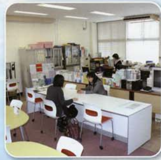
キャリアセンター