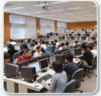
コンピュータ実習室